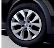
Jante aliaj 17", design Bahamas Sparkling Silver (RALU17/RDIF10)