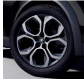
Jante aliaj 18", design Pasadena Grey Erbe (RALU18/RDIF21)